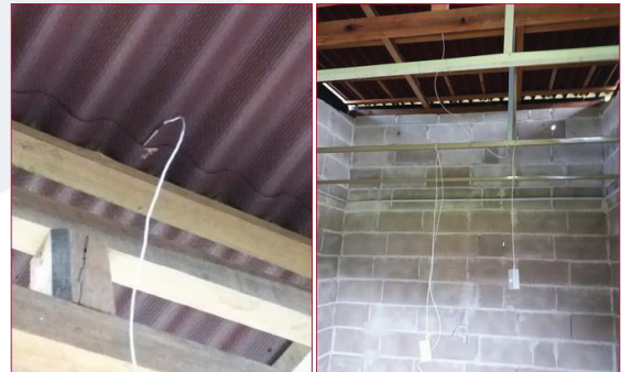
Thermocouples installed in building with Onduline roof

Three thermocouples were installed in each building: one outside to measure ambient temperature in the shade, one on the wall opposite the door, one under the roof, and one in the center of the room. Temperature were recorded every minute. Data was collected from Dec 20, 2019, to Feb 8, 2020, in Brazil. Despite some sensor failures in mid-January, the overall data was not affected. A sample of two consecutive days were used to represent the results.