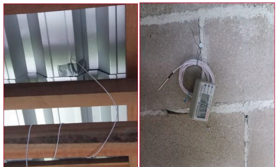
Thermocouples installed in building with metal roof