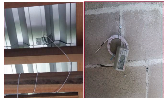
Cảm biến nhiệt được lắp đặt trong công trình có mái lợp kim loại